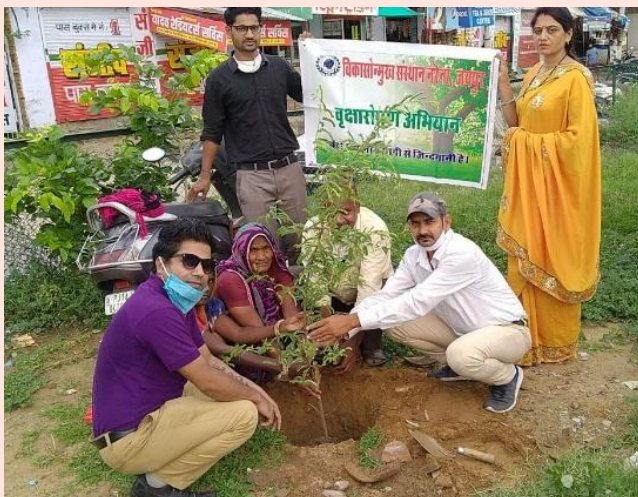
Outreach Member:40 villages Implemented area: 5 gram panchayat of Sambhar block (Phulera)